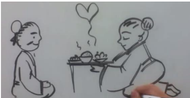
Man en vrouw