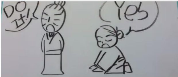
Vader en zoon