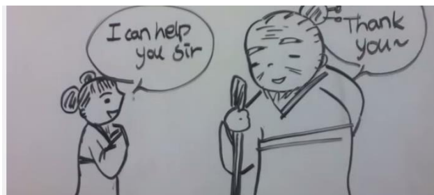
Oudere tegen jongere