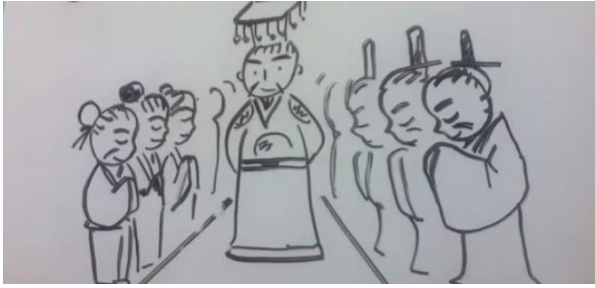
Leraar tegen leerlingen