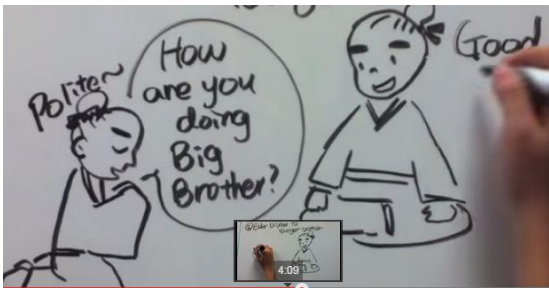
Oudere broer tegen jongere broer