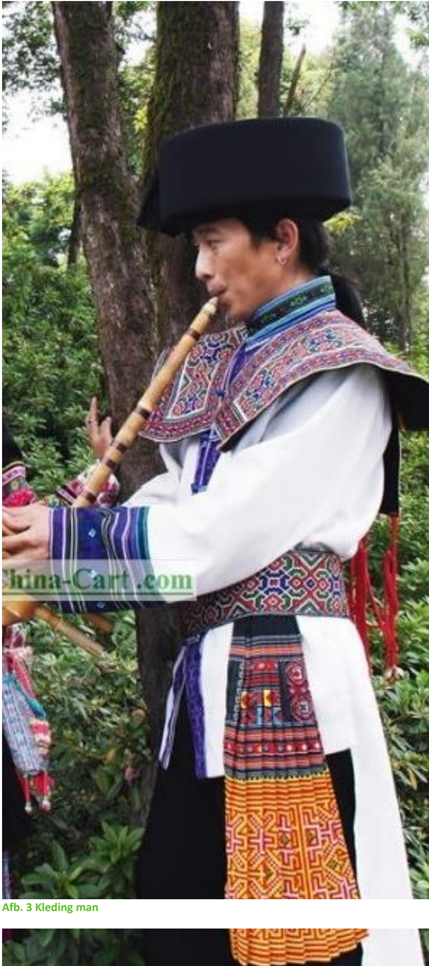
Afb. 3 Kleding man