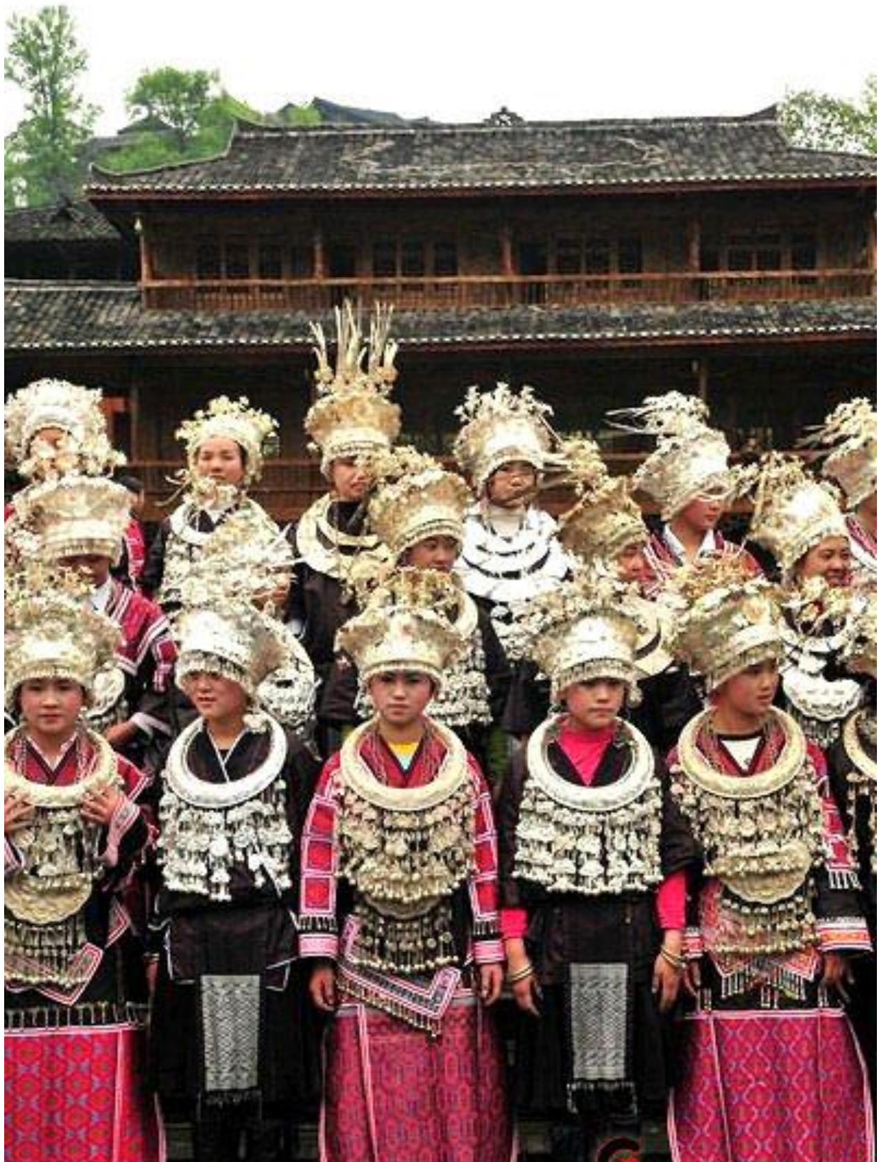
Afb. 4 Feestkleding vrouw- zilveren sieraden