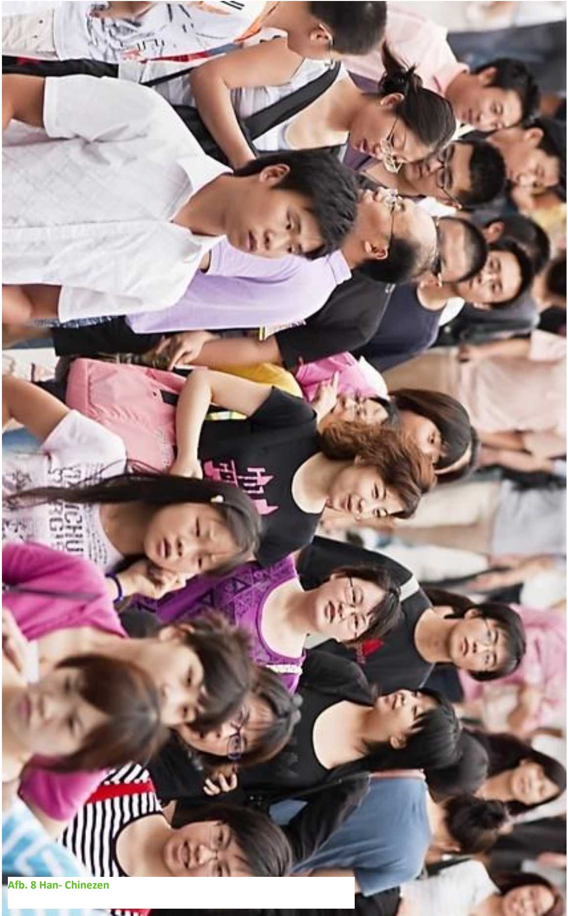
Afb. 8 Han- Chinezen