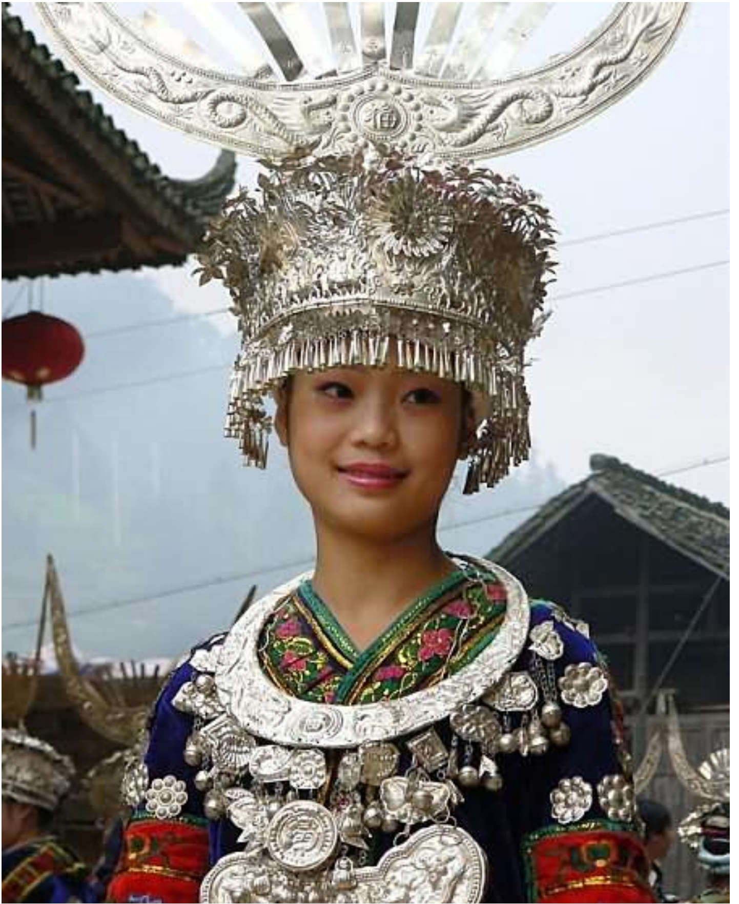
Afb. 5 Zilveren siereden- hoofdtooi en ketting