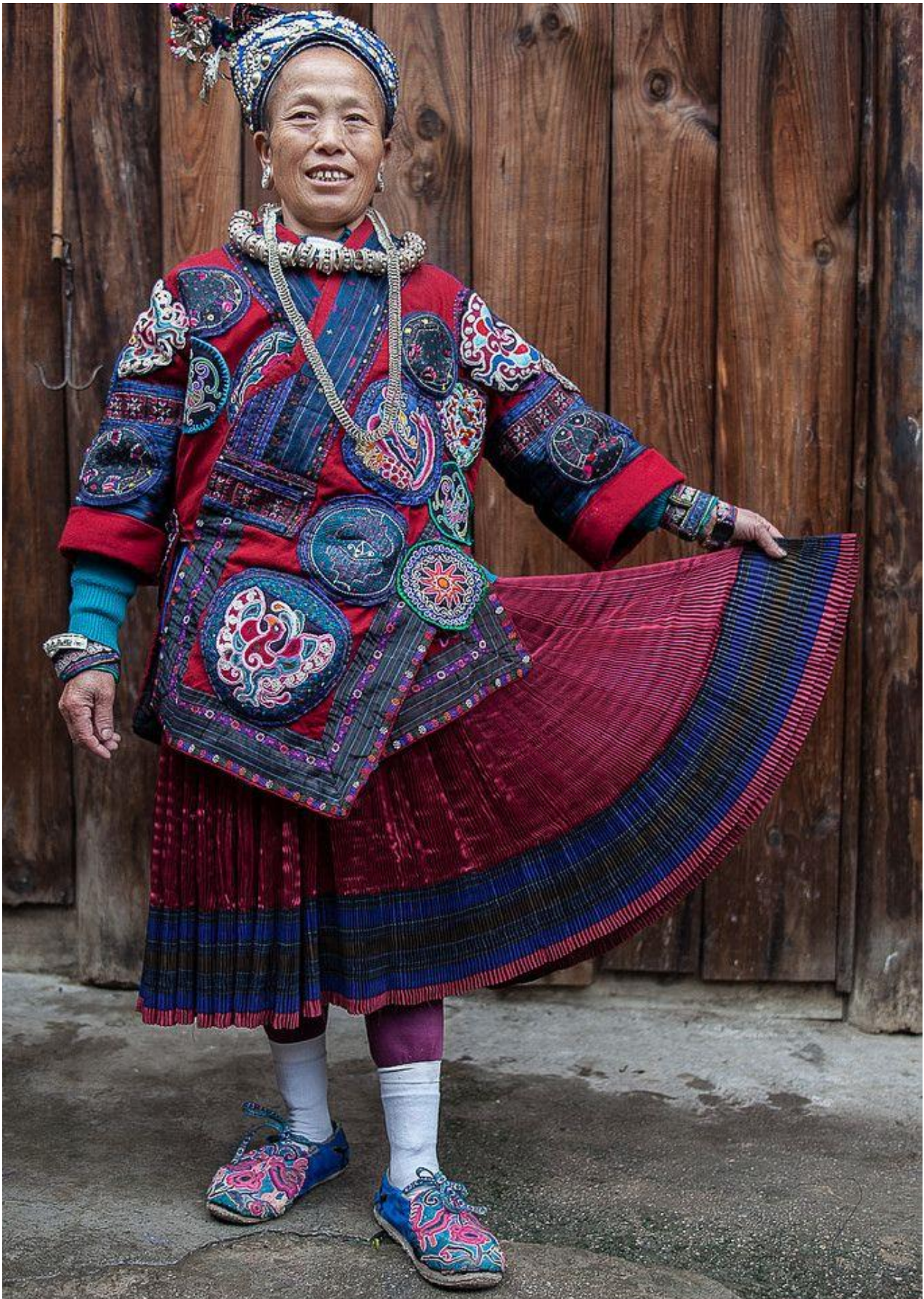
Afb. 6 Dagelijkse kleding vrouw- evaluatie