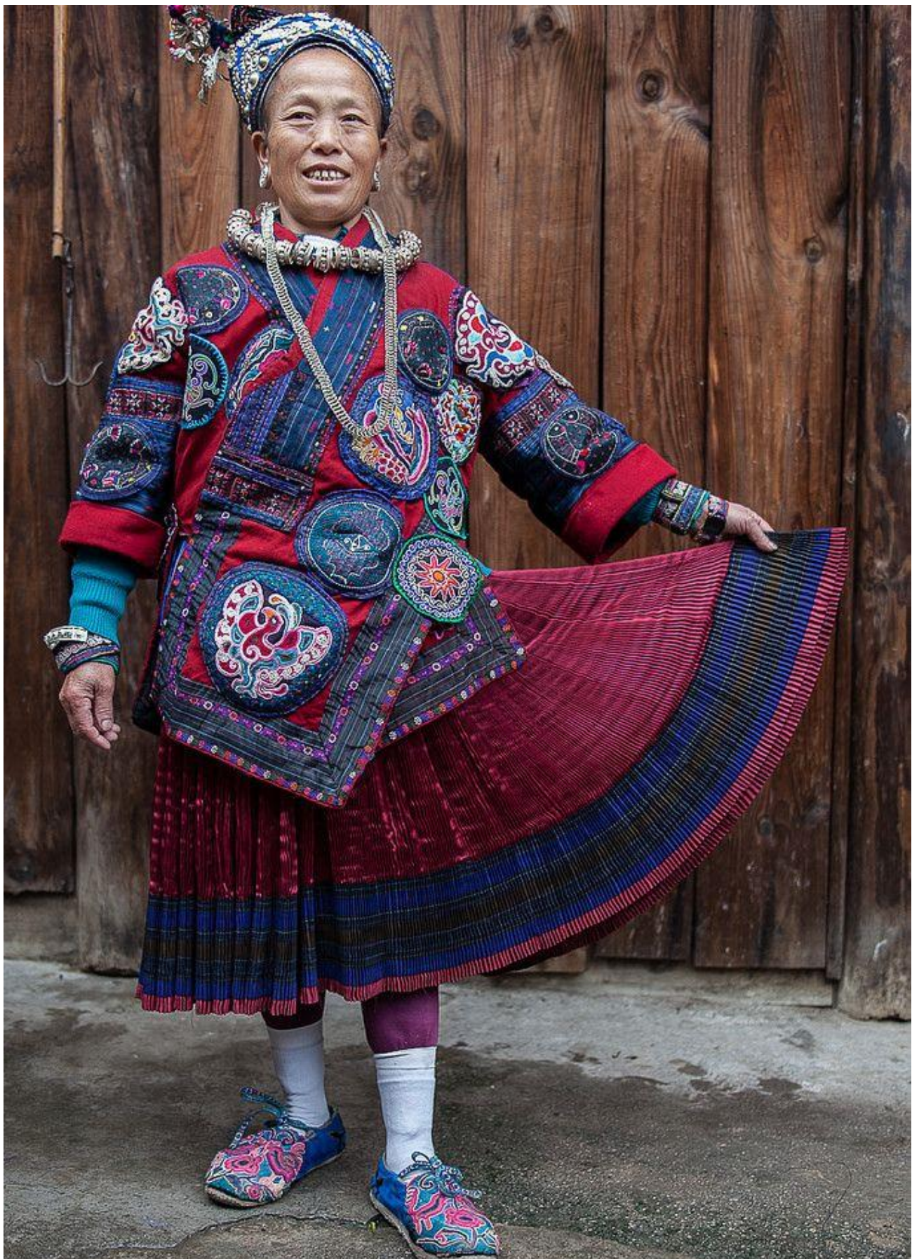
Afb. 1 Dagelijkse kleding vrouw- voorzijde