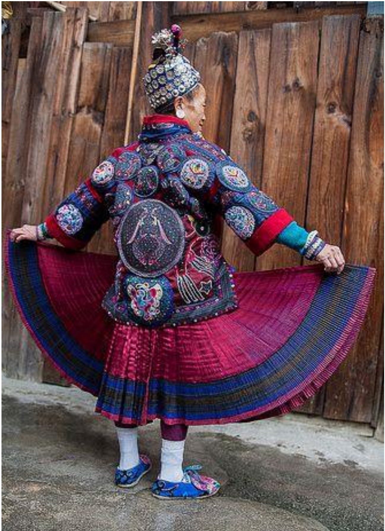
Afb. 2 Dagelijkse kleding vrouw- achterzijde