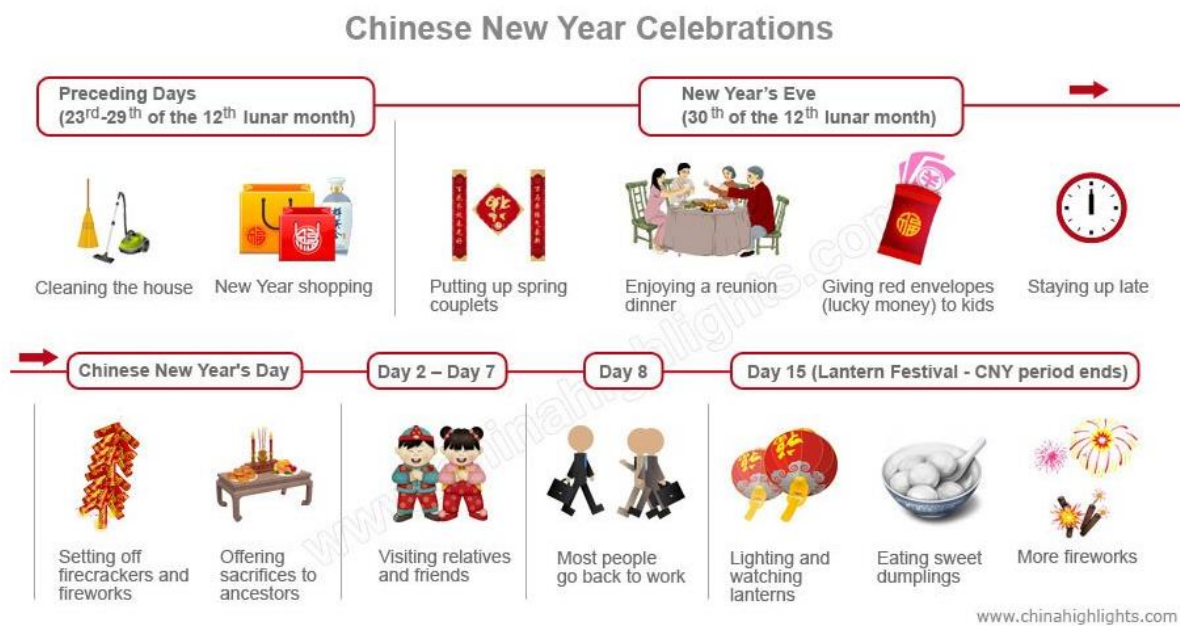
Figuur 4 De viering van het Chinees Nieuwjaar (Tang, 2017)

Allereerst de voorbereidingen, deze staan in het teken van het schoonmaken en opruimen van het huis. Alles moet grondig schoongemaakt en gereinigd worden; daarbij geldt niet een schoonmaak van alleen het huis, maar ook van jezelf, zoals het zorgen voor een nieuw kapsel. Met het schoonmaken laat je zien dat je het ongeluk van het vorige jaar opruimt en wegdoet om zo ruimte te creëren voor nieuw geluk in het komende jaar. (Kindsley, 2015)