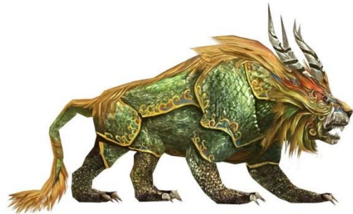
Figuur 2 Het monster Nian (Alien, 2016)

Beide verklaringen aangaande de oorsprong van het Chinees Nieuwjaar zijn erg verschillend en ook op verschillende bronnen gebaseerd. Omdat de Chinezen bij het Chinees Nieuwjaar de lente inluiden, wordt later ook van de feitelijke oorsprong uitgegaan en niet van de legende.