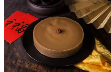
Figuur 6 Niangao (Azjo, 2007)

Na het uitgebreide familiediner delen de ouders rode enveloppen met geld uit aan de kinderen. Met het 'geluksgeld' wat de kinderen ontvangen, wensen de ouders hun kinderen geluk, gezondheid, groei en een goede studie. De rode kleur