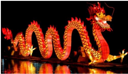
Figuur 1 Chinees Nieuwjaar in 2017 (BOM, 2017)

Van 1700 v. Christus tot 202 v. Christus werden er verschillende jaarcyclussen gehanteerd, totdat keizer Wudi in de Han Dynastie de maankalender invoerde. Sindsdien is Nieujaarsdag steeds meer ingeworteld geraakt. De overheid begon zich ermee te bemoeien door festiviteiten te organiseren. Daarnaast werden er steeds meer nieuwe gewoontes ingevoerd die wij ook kennen, bijvoorbeeld het opblijven tijdens de jaarwisseling. Het ploeg- en zaaiseizoen gaat van start en door gezang en dans wordt het nieuwe seizoen begroet.