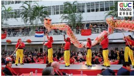
Figuur 7 Viering Chinees Nieuwjaar in Den Haag (CCEN, 2017)

Vooral in grote steden wordt het Chinees Nieuwjaar groots aangepakt. Hiermee worden steden als Amsterdam, Rotterdam en Den Haag bedoeld. In veel van deze grote plaatsen zijn ook 'Chinatowns' te vinden, waar uiteraard erg veel Chinezen wonen. In deze Chinatown (stadswijken) wonen veel Chinezen en zijn veel Chinese winkels, restaurants en tempels gevestigd.