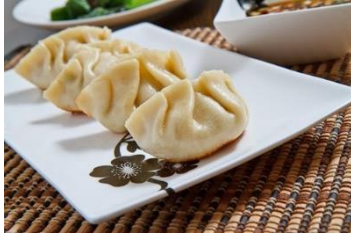
Figuur 5 Jiaozi (Lynch, 2011)

In Noord- en Zuid-China wordt verschillend voedsel gegeten tijdens het familiediner. In het Noorden wordt het typische jiaozi (dumplings) gegeten. In het Zuiden worden niangao (plakkerige rijstcake)