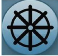
Figuur 1 Symbool Boeddhisme (Rad)